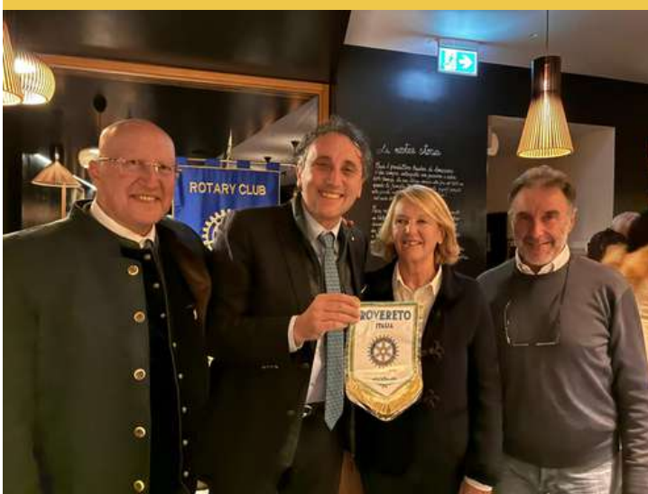
La consegna del labaro al Presidente del RC Cortina e al Sindaco.

Il weekend è stato un'occasione unica per vivere il territorio nel pieno della sua trasformazione olimpica. I Rotariani hanno avuto il privilegio di cenare al Rifugio Col Drusciè, in quella che è stata verosimilmente l'ultima possibilità di accedere all'area prima della chiusura definitiva per l'allestimento delle piste di gara: un momento irripetibile per vedere da vicino ciò che, di lì a poco, il mondo intero seguirà in televisione.