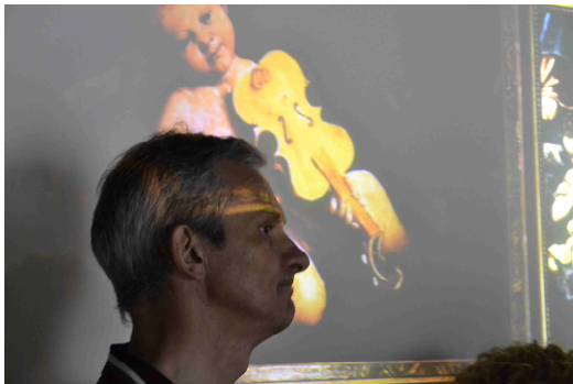
Un grande "maestro"!