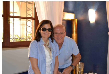
Vicino a un grande uomo, non può esserci che una grande donna!! Che coppia!!!