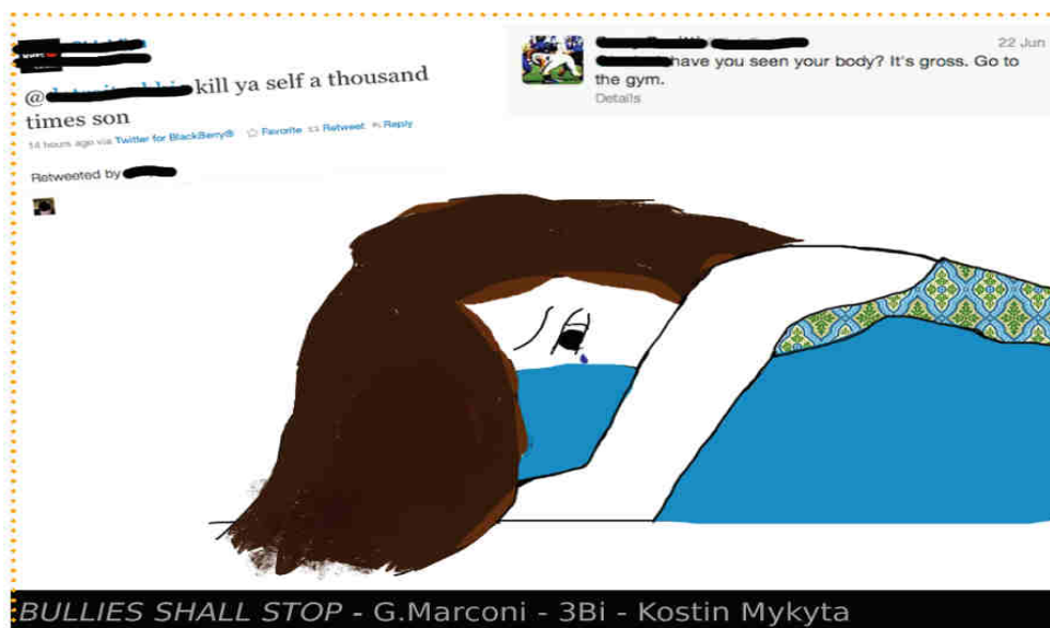
KOSTIN MYKYTA - G. Marconi - 3Bi - selezionato

La Cooperativa Sociale E.D.I. Onlus (Educazione ai Diritti dell'Infanzia e dell'Adolescenza) si occupa principalmente di inclusione sociale, partecipazione, benessere scolastico, contrasto ad ogni forma di abuso e maltrattamento. Inoltre si occupa di educazione ai media con progetti operativi su tutto il territorio nazionale.